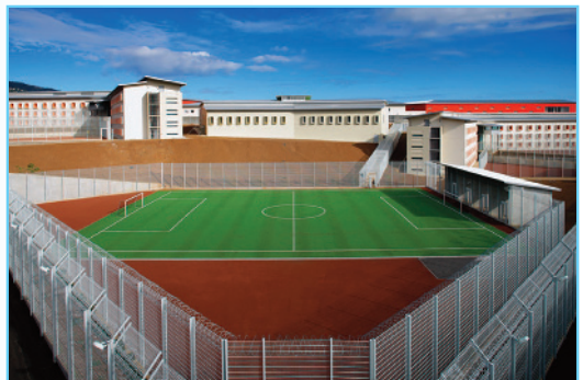
Centre pénitentiaire de Saint-Denis de la Réunion